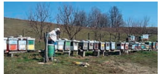
Mikrokreditkunden aus Albanien und Georgien: ein Gemüsebauer und eine Imkerin

■ NACHHALTIGKEIT: Der GLS-Fonds investiert vorwiegend in Mikrofinanzinstitute aus Regionen mit wenig Zugang zu Mikrokrediten. Diese müssen nachweisen, wie sie eine Überschuldung von Kunden verhindern. Sie sollen neben Krediten auch Sparkonten und Versicherungen (z.B. gegen Ernteausfall) anbieten. Pluspunkte gibt es, wenn die Mikrokredite der Umwelt nutzen. Die Mikrofinanzinstitute dürfen Kredite vergeben, die nicht für ein Gewerbe genutzt werden. Diese müssen „sinnvolle“ Anschaffungen finanzieren wie zum Beispiel energieeffizientere Öfen. Das unterscheidet den GLS-Fonds von vielen Mikrofinanzfonds, die nur Kredite an Unternehmungen finanzieren. Ob ein Mikrofinanzinstitut die Anforderungen erfüllt, prüft das Fondsmanagement vor Ort. Ein Anlagebeirat mit GLS-Mitarbeitern und unabhängigen Experten prüft die nachhaltige Ausrichtung des Fonds.