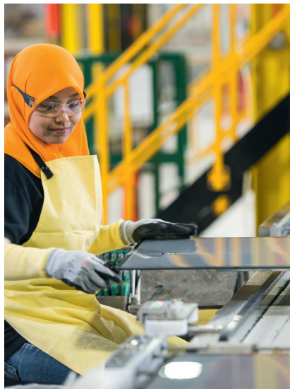
Filiale von Sprouts Farmers Market, Produktion bei First Solar.

■ Nachhaltigkeit: Der Fonds investiert zum Testzeitpunkt in 48 kleine und mittlere Unternehmen, die als Vorreiter für nachhaltige Produkte und Technologien gelten. Zudem dürfen sie nicht gegen eine Vielzahl von Ausschlusskriterien verstoßen. Einige Ausschlusskriterien wie Geschäfte mit Pelzen greifen ab 10 % des Umsatzes. Der Fonds investiert vorrangig in die Sektoren Industriebetriebe, IT und Gesundheitswesen. Vertreten sind z.B. der dänische Windanlagenbauer Vestas, die Solarfirmen SolarEdge und First Solar und die Öko-Lebensmittelunternehmen Sprouts Farmers Market und Hain Celestial. Der Fonds enthält zu einem Fünftel japanische und zu fast zwei Fünfteln US-Aktien. Das hauseigene Nachhaltigkeitsresearch von Triodos bewertet die Nachhaltigkeit; Daten dafür liefert die Nachhaltigkeits-Ratingagentur Sustainalytics. Einmal jährlich werden die Unternehmen neu bewertet. Es gibt keinen Nachhaltigkeitsbeirat, der Einfluss nimmt oder die Nachhaltigkeit des Portfolios kontrolliert.