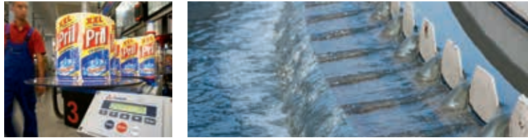
Henkel verbraucht bei der Produktion immer weniger Wasser. Severn Trent ist ein Versorger und reinigt auch Abwässer. Beide Aktien sind im Fonds enthalten.