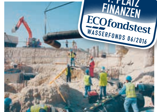
Aktien des KBC-Fonds: Suez bereitet Abwasser auf, und Georg Fischer baut Rohre für Wasserleitungen.